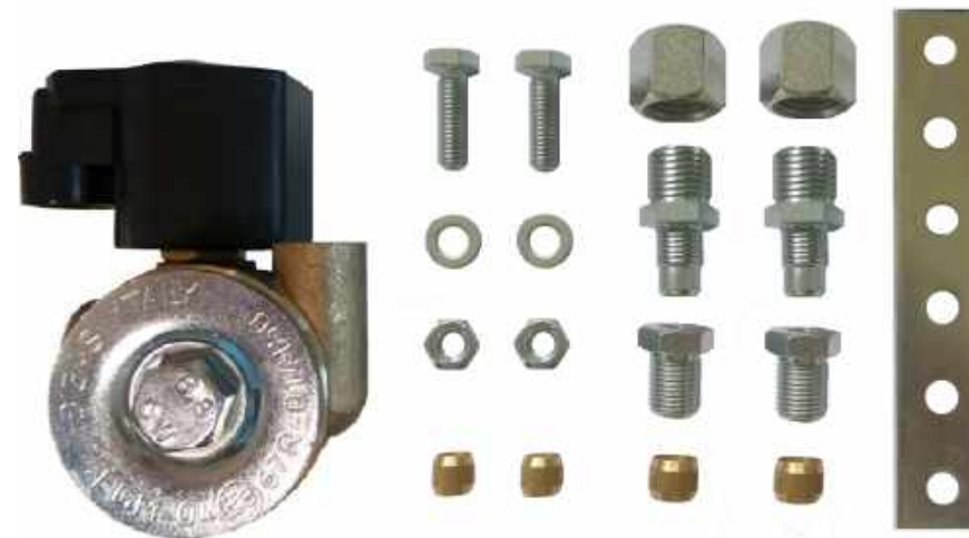
Fig. 1 - Rappresentazione figurativa del riduttore completo dei suoi accessori